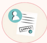
2 - Validation

Vous recevez un mail pour activer votre compte sur particulier.urssaf.fr