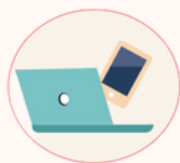
1 - Inscription

Avec votre autorisation, nous créons votre compte